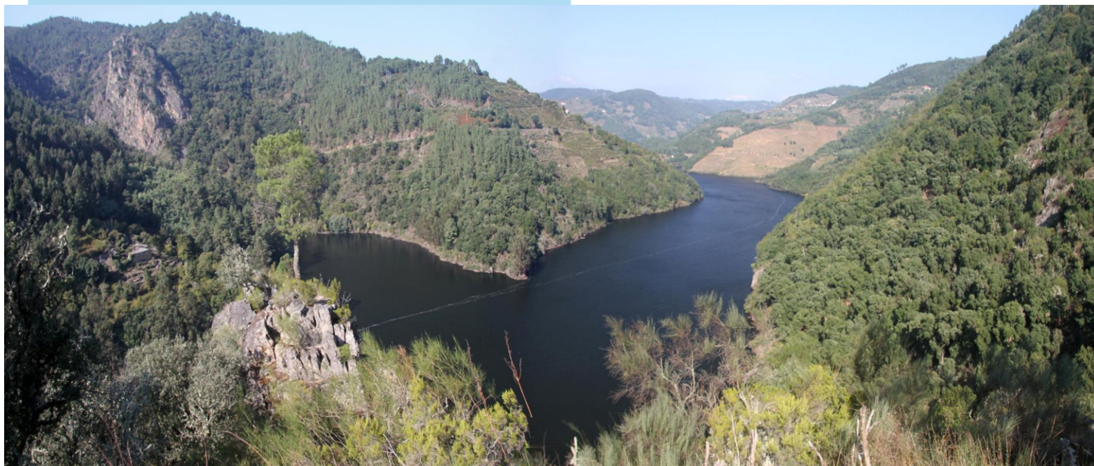
Panorámica desde o Penedo do Garabullo ata o sobreiral de Marce