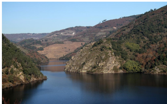
O Castro desde Chouzán (Carballedo)