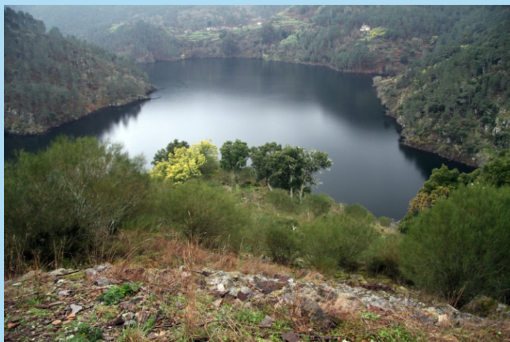
Canón do Miño do Miño desde o Castro de Marce

Desde Ferreira pola estrada de Ourense a Monforte en dirección a Ourense saímos no cruce de Guítara e cruzando por enriba dela para continuar pola estrada vella en sentido Ourense, atopamos ao pouco o desvío, á dereita, a Marce, e o indicador da fervenza; en 4 km chegamos o punto de inicio da ruta (un pouco antes de chegar, ao pé mesmo do panel do inicio da camiñada, e tamén un pouco despois de pasalo, hai pequenos espazos de aparcamento). A distancia á fervenza según nos din no mesmo panel é de 1.400 m por un camiño en boas condicións con tramos en bastante pendente sobre todo nos últimos 200 m, aínda que o que ata hai pouco tempo era un descenso apto para moi poucos, incluída a baixada coa axuda de cordas, agora, coa instalación de escaleiras, pódese considerar un paseo apto para todo tipo de persoas. Para achegarse ao castro hai que facer un desvío, sinalizado, de 650 m (1.300 m ida e volta) por un camiño que se fai carreiro sen apenas desnivel, a non ser no mesmo