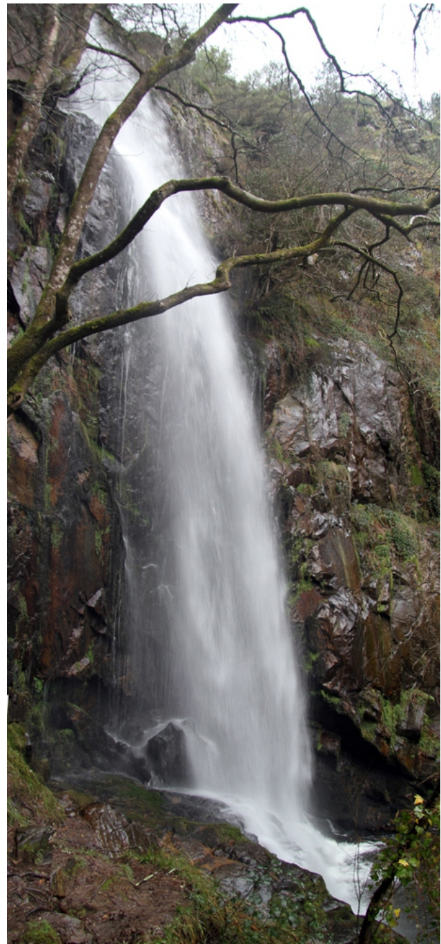
Ferverza de Augacaída